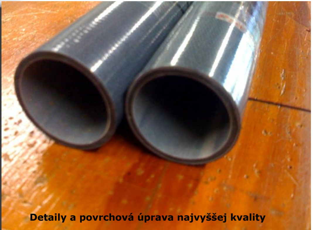
Detaily a povrchová úprava najvyššej kvality